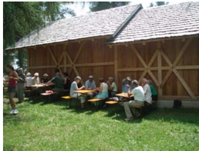
Frokost ved hotellets "Baita"